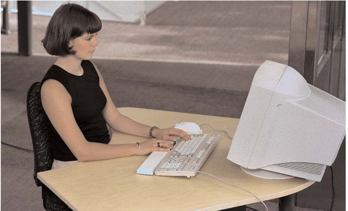
Avslappnad och balanserad arbetsställning.

INFORMATIONSTIDNING TILL DIG SOM ÄR KUND HOS ÖSTERMALSHÄLSAN • april 2003